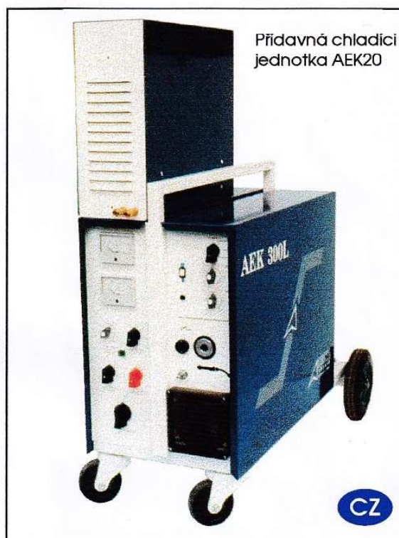
Přídavná chladicí jednotka AEK20

Mezikabel mezi zdrojem a posuvem má volitelnou délku.